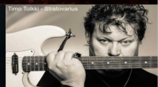
Timo Tolkki - Stratovarius