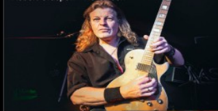
Timo Tolkki - Stratovarius